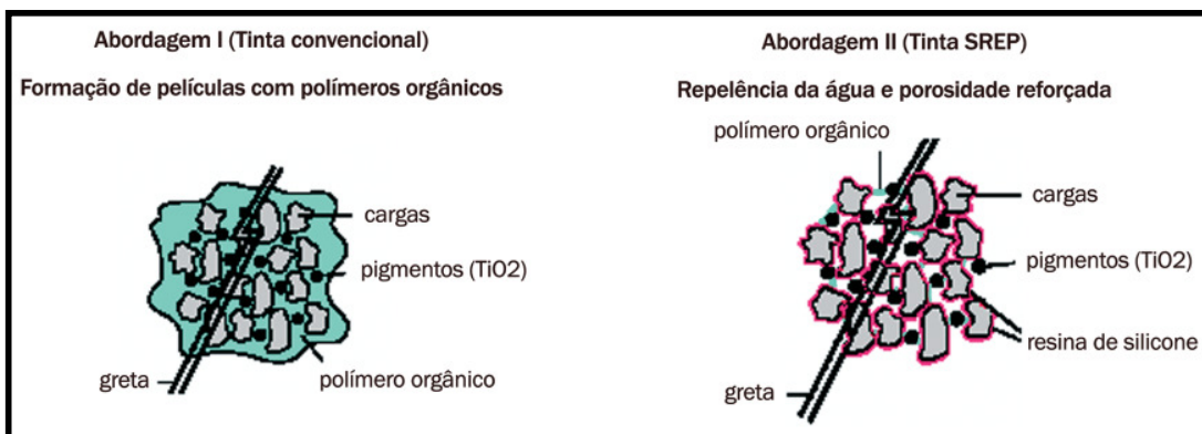
Figura 3: Diagrama esquemático da tinta de emulsão de silicone. Por James Greene, Danielle Haeussler e Bruce Berglund, Ph.D. / Wacker Silicones Division, Wacker Chemical Corp. USA..

O resto dos componentes (pigmentos, cargas, agentes auxiliares) são comparáveis com aqueles que são utilizados em tintas base água de qualidade.